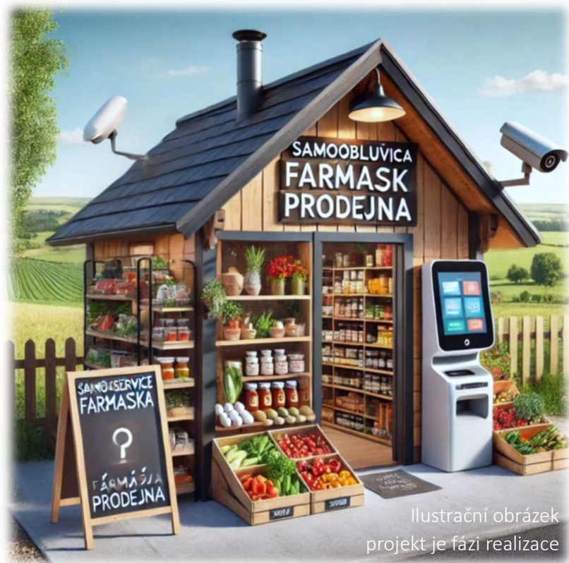
Ilustrační obrázek projekt je fázi realizace